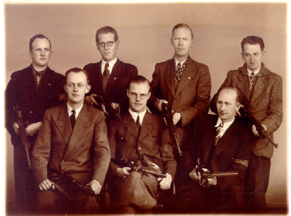
Fortalt af Jens Christian Vils Pedersen